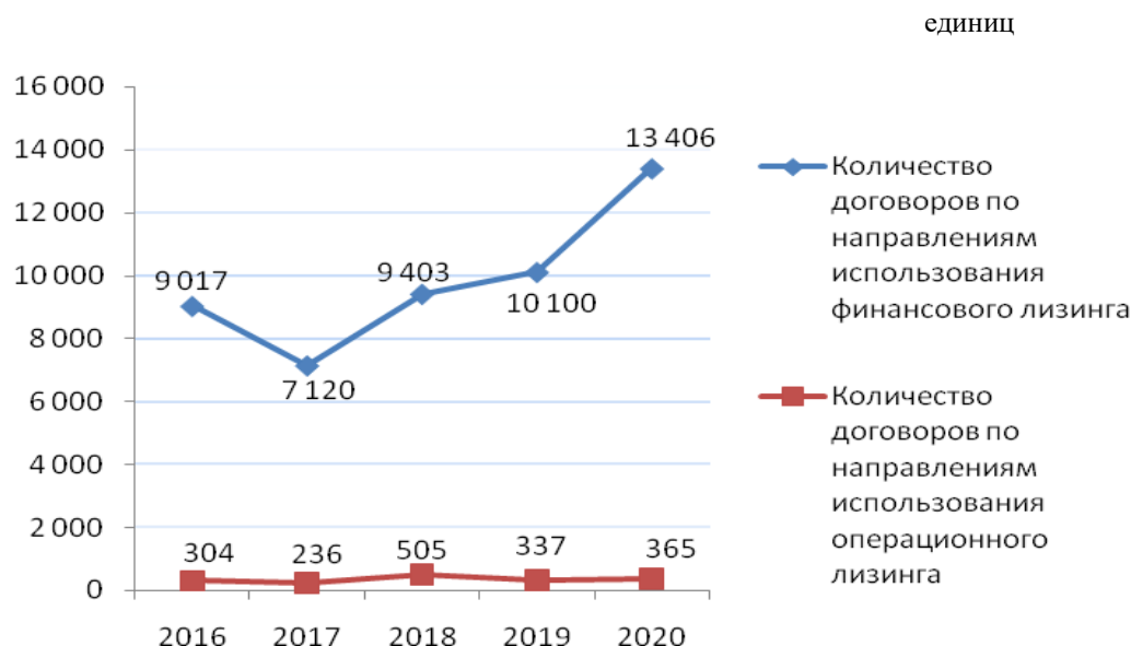
Диаграмма показывает, что количество договоров финансового лизинга больше, чем количество договоров операционного лизинга. Финансовый лизинг в 2020 году составил 13406 единиц, а операционный лизинг - 365 единиц соответственно.