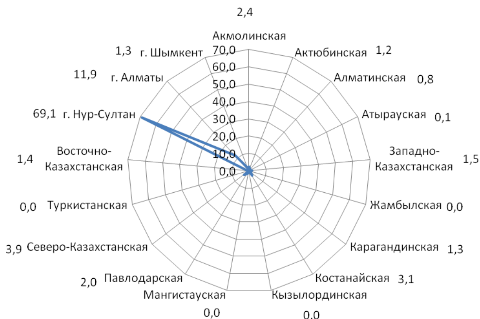
Диаграмма показывает, что к 2020 году наибольшая доля договоров финансового лизинга приходится на г.Нур-Султан – 69,1%, г.Алматы – 11,9%. Договоры финансового лизинга отсутствуют в Туркестанской, Кызылординской, Жамбылской областях.